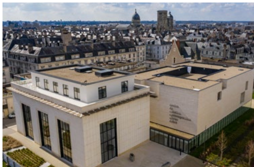
Le bâtiment du CCCOD par l'agence Aires Mateus © air2d3

En plein cœur historique de Tours à quelques pas de la Loire, le centre d'art contemporain de Tours s'est installé depuis 2017 dans un nouveau bâtiment conçu par les architectes Aires Mateus .