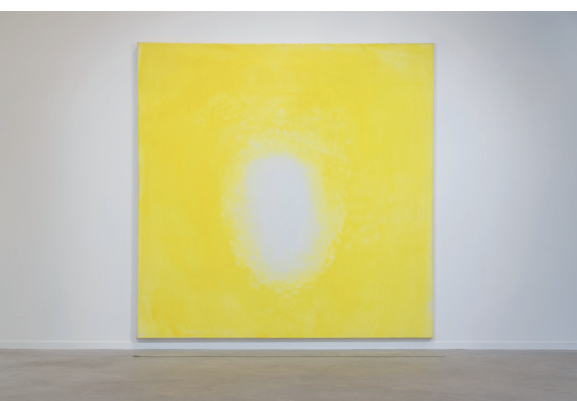
Olivier Debré, sans titre , c.1988, huile sur toile, 280 x 280, Collection particulière, photo ville d'Amboise.

Exposition en partenariat avec l'Atelier Calder à Saché (37), où Rosa Barba a été accueillie en résidence de mi-septembre à mi-décembre 2021. Commissariat : Elodie Stroecken