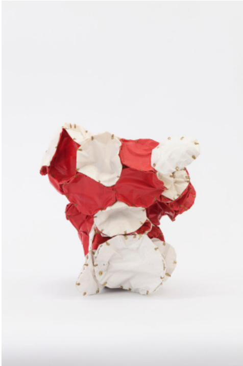
Miho Dohi, buttai 71 , 2019, ruban adhésif, fils de laiton. Galerie Crève-cœur, Paris

Miho Dohi est née en 1974 à Nara, Japon. Elle est diplômée de la Tokyo Zokei University, et vit et travaille à Kanagawa. Elle crée des petites structures curieuses à travers l'assemblage de multiples matériaux, tels que le plâtre, la peinture, le cuivre ou encore le bois, le papier et le tissu. Frustrant toute tentative d'analyse formelle, les matériaux de ces objets semblent être choisis et assemblés au hasard ; ils tiennent ensemble selon une logique aussi indéniable qu'indescriptible, et exercent ainsi un pouvoir de fascination subtil mais puissant.