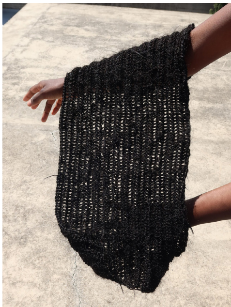
Attandi Trawalley, Don't get attached , 2022, 100 % kanekalon, dimensions variables.

Diplômée de la Villa Arson en 2021, Attandi Trawalley vit et travaille à Paris. Sa pratique, qui se déploie à travers le textile, la céramique, et la performance, se focalise sur le soin, et en particulier les gestes, rites et rituels de soin des femmes noires.