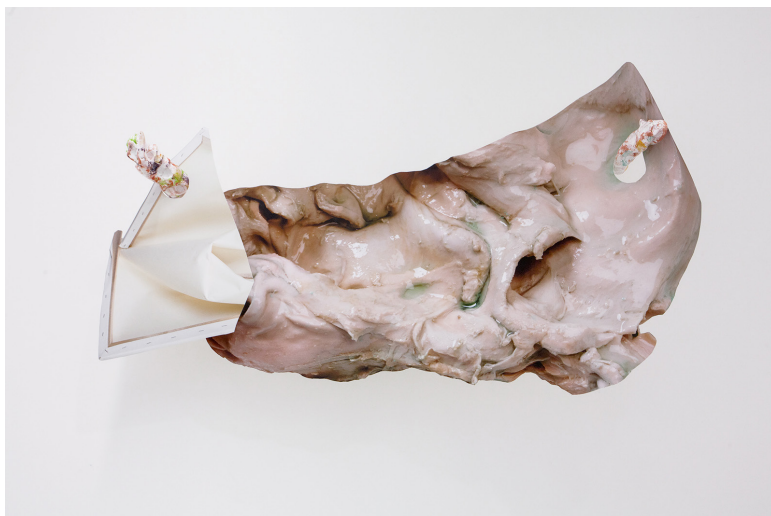
Rachel de Joode, Playing Me #5 , 2018, céramique émaillée, impression d'art sur toile. Galerie Christophe Gaillard, Paris

Rachel de Joode brouille ainsi non seulement les limites entre l'humain et le minéral, le geste et la trace, mais revient aussi sur l'histoire de la sculpture et de la céramique avec les outils numériques afin de repenser le corporel sur le mode de l'assemblage et du collage, comme un champ de possibilités plutôt qu'une finalité.