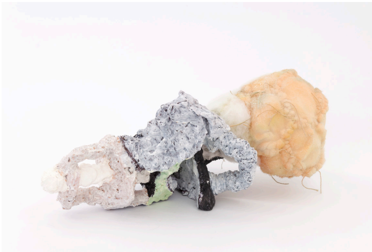
Miho Dohi, buttai 73 , 2019, plâtre, coton, fil, acrylique et peinture. Galerie Crève-cœur, Paris

appellent à l'imagination, à la contemplation, et à la projection tactile, et peut-être même à une forme de sympathie ou d'identification.