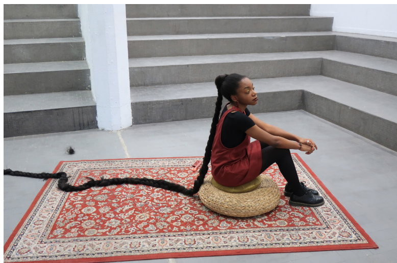
Attandi Trawalley, Braid me , 2020, performance. Courtoisie de l'artiste