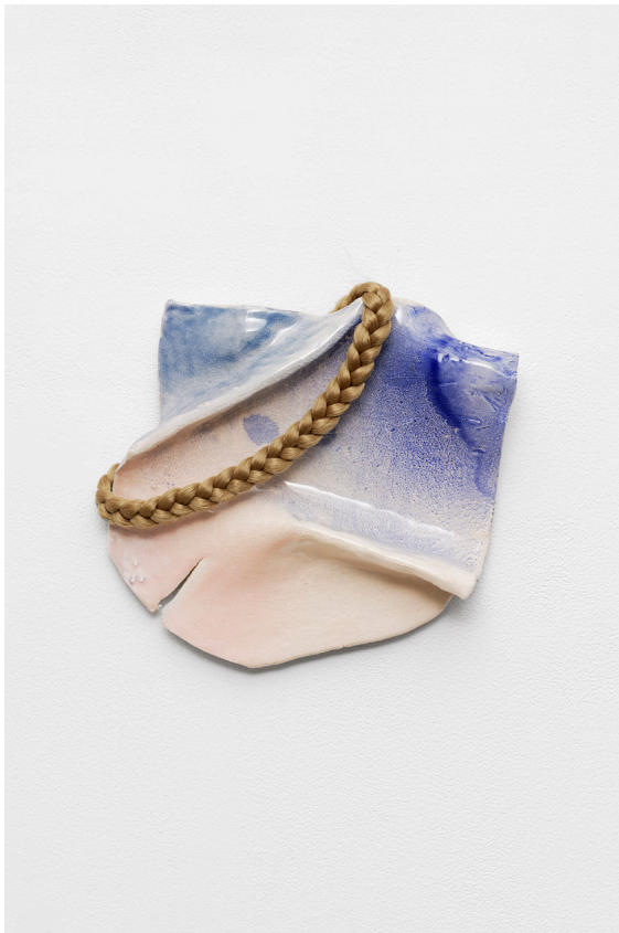
Bettina Samson, Une I , 2021, céramique émaillée, cheveux synthétiques.

Ces temporalités éloignées cohabitent ainsi dans la même série. Les formes sont irrégulières et fissurées, comme s'il s'agissait de fragments précaires d'un tout inaccessible ou perdu. Les couronnes tressées prêtent néanmoins une cohérence à la série et une sorte de personnalité à ces plaques, elles les dotent d'un aspect anthropomorphe, féminin et juvénile, les transforment en portraits anonymes d'une sororité désincarnée.