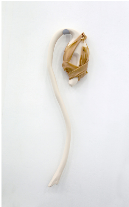
Cécile Bouffard, Coincée, coincée, coincée , 2017, bois, métal, peinture acrylique, textile.

Cécile Bouffard est un.e artiste français.e né.e en 1987. Elle est diplômé.e de l'École nationale supérieure des Beaux-Arts de Lyon en 2014, et vit et travaille à Paris.