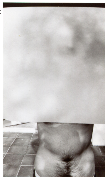
Georges Tony Stoll, Performance inconnue , 2011, photographie argentique noir et blanc sur papier baryté contrecollé sur aluminium. Galerie Jérôme Poggi, Paris

Cette conception se retrouve dans notre projet curatorial, dont le titre renvoie aux théories de Preciado. Postcorps : au-delà du corps. Postcorps : une exploration de ce qu'est, ou n'est pas, le corps. Postcorps : un voyage parmi différentes visions du corps, qu'elles soient sexuelles, spirituelles, organiques, médicales ou même bioniques.