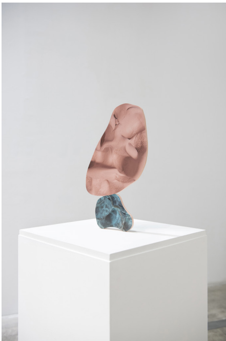
Rachel de Joode, Arrangement on Pedestal I , 2015, impression jet d'encre sur PVC, Galerie Christophe Gaillard, Paris

Ses sculptures intègrent en effet des plaques aux formes irrégulières et fluides sur lesquelles sont imprimées des photographies ou photocolpages numériques composés de prises très rapprochées de matériaux différents, notamment l'argile, la terre, ou la peinture acrylique. Caractérisées par des tons roses ou bruns clairs qui rappellent des teintes charnelles, ces éléments sont dotés d'un biomorphisme à la fois repoussant et fascinant. Les surfaces photographiées portent par ailleurs les impressions d'un travail manuel – empreintes digitales, plis, sillons – qui accentuent la confusion entre corps humain et matière informe. De série en série, Rachel de Joode expérimente de multiples assemblages et formes d'accrochage pour ces éléments imprimés, qui sont tour à tour suspendus à des crochets de céramique, imbriqués dans des socles minéraux, ou empilés pour créer des sculptures anthropomorphes précaires. Elle renvoie ainsi vers une forme d'incarnation inédite, où se confondent gestes artisanaux, manipulations numériques et processus somatiques pour donner à voir des corps en ébullition, saisis dans une métamorphose fluide et chaotique.