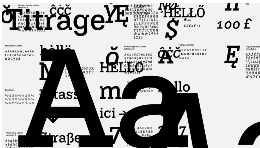
image extraite du film « CCC OD : naissance d'un caractère typographique »

Un remix des systèmes graphiques inventés baldinger•vu-huu depuis plusieurs années.