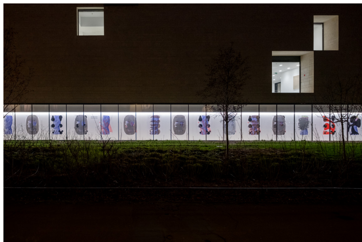
vue de l'exposition « Confluences » au CCC OD

« The 7th China International Poster Biennial », Hangzhou, Chine