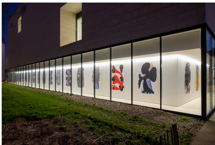
vue de l'exposition « Confluences »