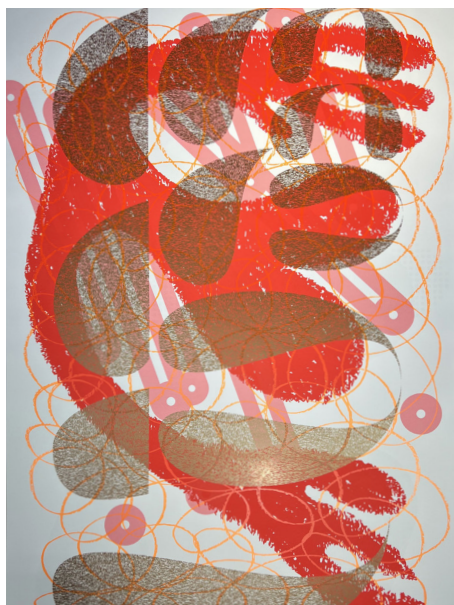
affiche