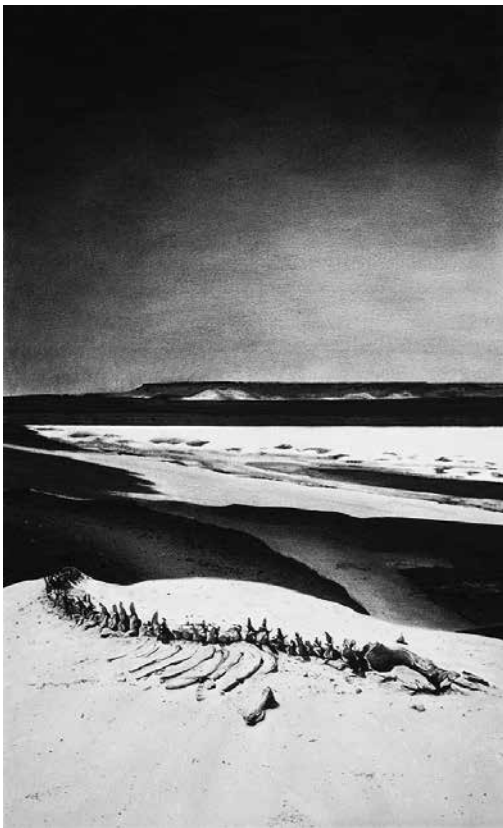
Archéocètes 03 , 2019, dessin à la pierre noire, 71 x 48 cm

L'artiste présente les œuvres produites après son séjour au Fayoum Art Center en 2018, lors d'une résidence CCC OD hors les murs.