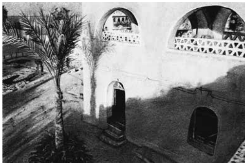
Paysages 16 , 2019, série de 10 dessins à la pierre noire, 25 x 35 cm

Cette nouvelle exposition dans les galeries du centre d'art est le fruit de cette immersion dans l'oasis du Fayoum, source d'inspiration exceptionnelle pour cet artiste qui envisage depuis toujours le dessin dans une approche quasi archéologique, attentive aux traces laissées par le passé. Ce séjour lui a ainsi permis d'explorer les strates d'une culture millénaire, tout en se confrontant physiquement à l'étendue et à la lumière éblouissante du désert. Un choc esthétique pour cet artiste adepte du dessin à la pierre noire, dont l'univers plastique s'est plus volontiers construit dans une relation forte à l'obscurité.