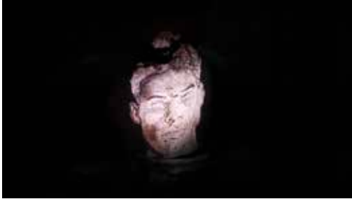
Hussein, 2019, film d'animation, full HD, 16/9

Lors de son séjour dans le Fayoum, Mathieu Dufois a pu prolonger ses réflexions sur le dessin et le cheminement de la mémoire. Ce contexte de découverte lui a inspiré l'ensemble des productions réalisées spécifiquement pour l'exposition : séries de dessins à la pierre noire, vidéo ou film d'animation, toutes résonnent de son expérience égyptienne.