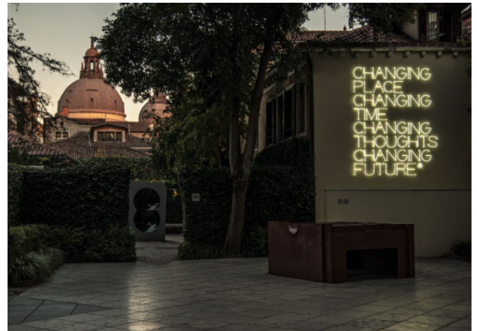
Changing place , 2003 Museo Guggenheim, Venezia