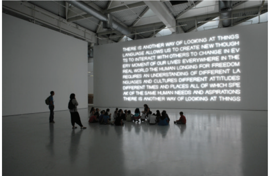
There is another way of looking , 2009 Musée de Saint-Etienne