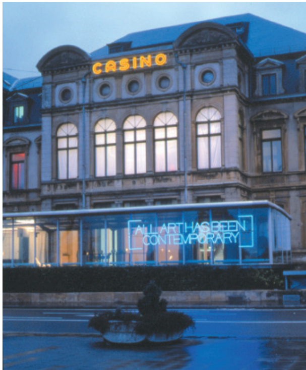
All art has been contemporary , 2000 Casino Luxembourg, Luxembourg